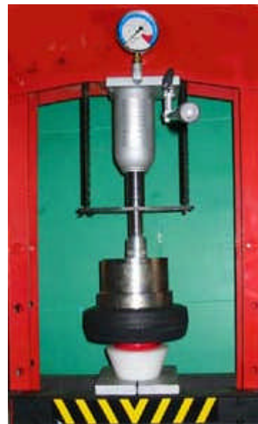
L'effort de montage est inférieur à 250 kg