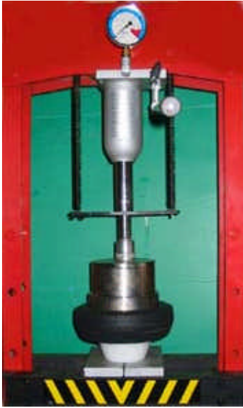
Descendre le piston jusqu'au montage complet du bandage