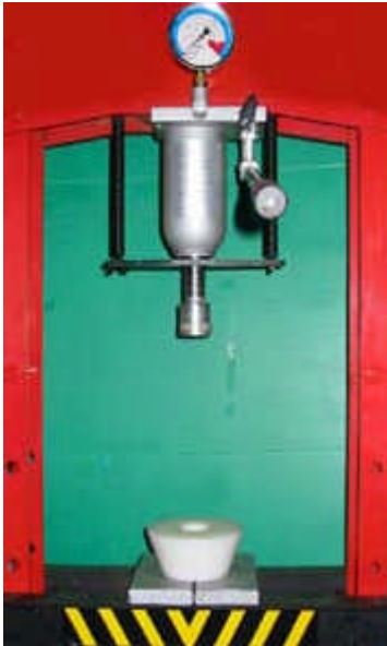
Le cone blanc sert de cale pour ajuster le positionnement vertical du montage.