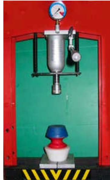
Poser le cone de montage sur la jante