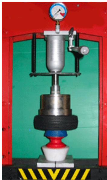
Poser la virole sur le bandage puis descendre le piston de la presse