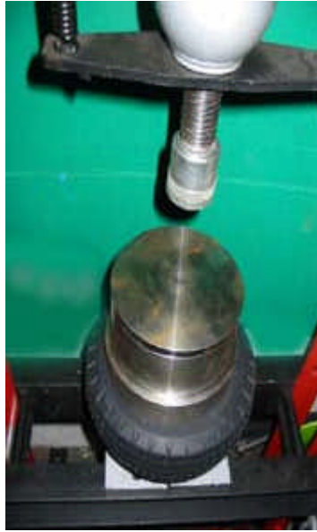
Relever le piston