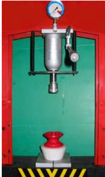
Poser la jante horizontalement