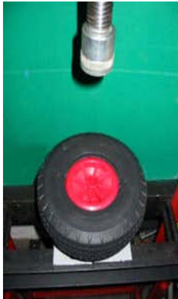
Si nécessaire, repousser le talon du bandage derrière le flanc de la jante