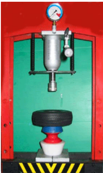
Poser le bandage plein sur le cone