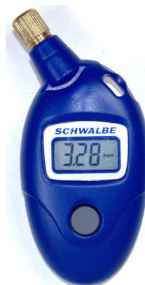
Airmax Pro Manomètre digital