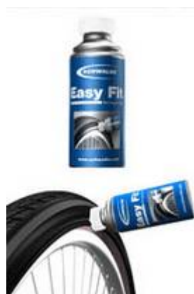
Liquide de montage 50 ml