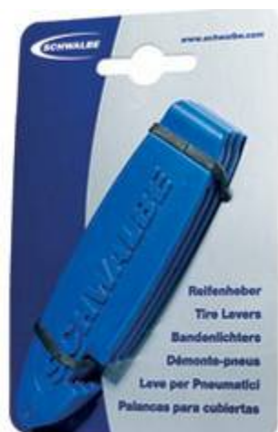
Set de 3 démonte-pneu