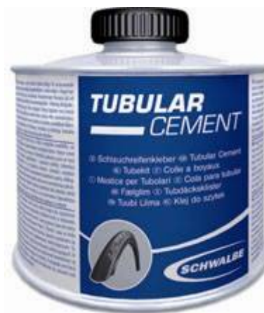
Colle à boyau - Brosse d'application dans le bouchon